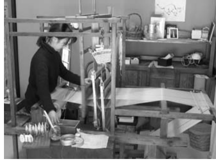
秋に採ったクサギの実で染めた絹糸を織る。