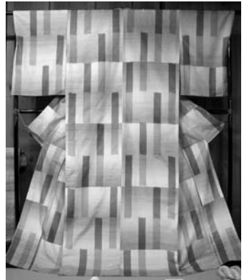
猿八の木苺で染めた糸で織り上げた着物。

つては軽トラックに積んできて糸を染めていたものだ。そしてその発色の良さにまた驚いた。採れたての植物を使うせいかな、そもそも植物の生命力が違うのか、あるいは水の下さ（ここ猿八集落は水道がなく、水は湧き水が井戸水なのである）のせいなのか、とても透明感のある美しい色が染まる。