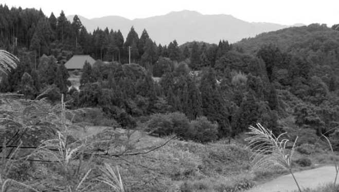
猿八集落。正面には佐渡随一の金北山がそびえる。

京都で染織家の弟子として仕事をしていたときには、染料になる草木は貴重なものだった。だから、この集落に来たばかりの頃は、染料植物が無造作に生えているのを見て驚き、山に入