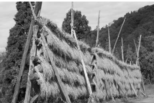
収穫された稲はざ木に掛けられる。猿八ではごく当たり前の風景だが、こんな風景に思わず心和む。

この頃から秋の稲刈りまでは「野暮に忙しいっちゃ」とか「あんだ、忙しいだろっ」というのが挨拶代わりだ。しかし、忙しいと言つても「自分自身を消耗してゆく」感じが全然ない。「忙しさ」に自信があるというか、皆、堂々と忙しい。都会に住んでいたときには「忙しさ」の中にはいつも焦りと不安があったが、この地では私たちもまた、「堂々と忙