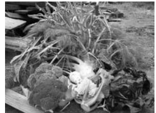
秋に採れた野菜。プンタレラやラディッキオといった珍しいイタリア野菜やハーブなども収穫。

真夏になれば青い稲が集落中を包む。いよいよアワビにサザエ、そしてしやしきしやしきとした歯ごたえの石毛ズクなどが旬を迎え、「島の夏」を堪能できる季節だが、こちらはもう秋のことを考えている。秋野菜の作付けがはじまるからだ。大根、かぶ、小松菜、ほうれん草、白菜、水菜などの種を蒔き、キャベツ、ブロッコリ、カリフラワーなどの苗を植えつける。そしてひと冬分のトマトソース作りもある。